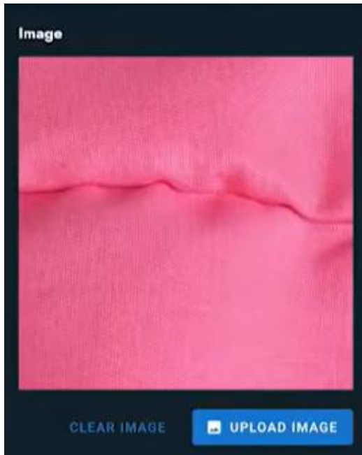
KI-basierte QS in der nahenden Industrie